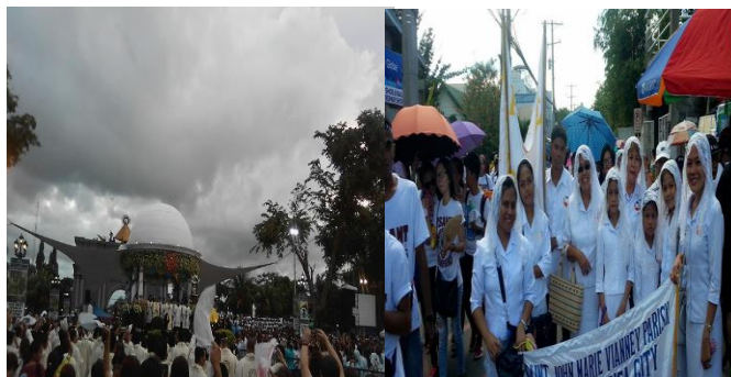
Larawan blg. 3. Ang pagsalubong ng mga deboto at kaparian sa Imahе ni INA at Divino Rostro sa Metropolitan Cathedral

Ang larawan blg. 3 ay nagpapakita na hindi alintana ng mga mananampalataya ang init ng araw o lakas ng ulan para masaksihan ang pagdating ni INA sa Metropolitan Cathedral. Makikita ang galak sa mga taong naririto kahit masungit ang panahon.