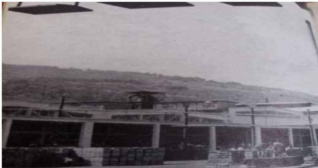
Фигура 1. Консервен комбинат „Република“ (Ivanov et al., 1966 )

Заводът за стоманобетонени изделия „Георги Терзиев“ произвежда струнобетонни траверси за ж.п. линии, стълбове, елементи за селскостопанско, мелиоративно и промишлено строителство. Консервеният комбинат „Република“ произвеждал консерви, които се реализират както на вътрешния пазар, така и по света - в СССР, ГФР, Англия, Австрия и др. Предприятието „Текстилни влакна“ извършва първична обработка на конопено влакно и производство на паздеритови плоскости. Държавното предприятие за зърнени храни „Дунав“ произвежда бели и типови брашна и преработва ориз. В дърво-металната ТПК „Червена звезда“ се произвеждат различни видове мебели. Пристанището в Свищов е модерно за времето си чрез механизация на процесите по товарене и разтоварване на стоки, като по технически показатели отстъпва само на русенското. В неговия район работят още Държавно предприятие „Металснаб“ за търговия с цветни и черни метални изделия, клонът на „Петрол“ за снабдяване с горива и Дунавския драгажен флот, чрез който се добива пясък и баластра за строителството.