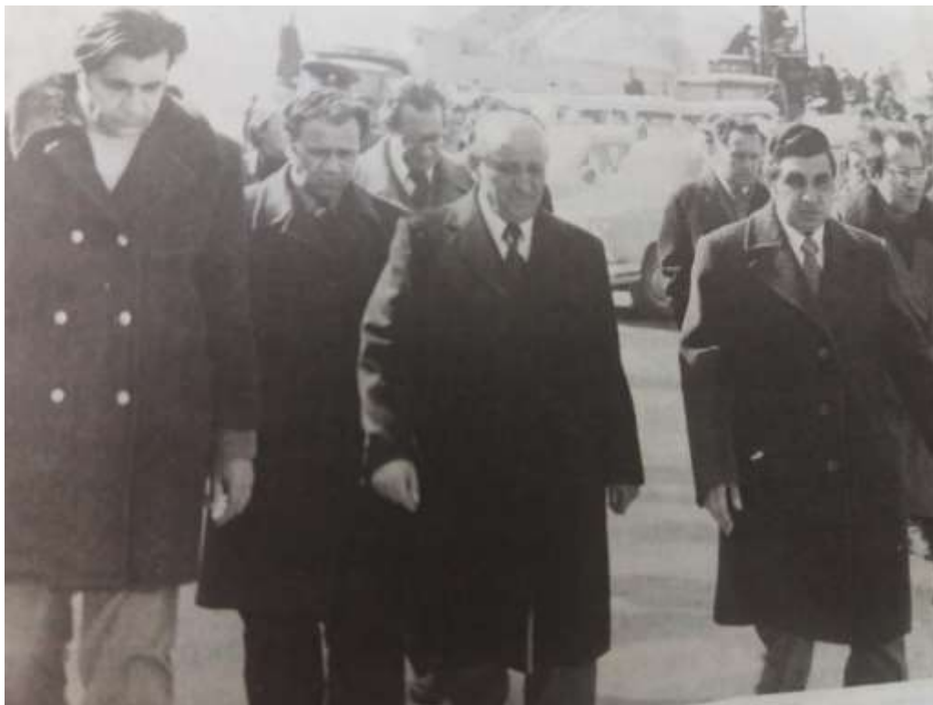
Фигура 6. Посещение на генералния секретар на ЦК на БКП и председател на Държавния съвет Тодор Живков в Свищов (Brankov et al., 1983)

по време на тази екстремна ситуация са твърде сложни – от страха и ужаса до героизма, от пълното отчаяние до мобилизиране на волята на личността“ (Brankov et al., 1983). Самият Живков, според публикации в пресата, станал очевидец на създалата се паника в населението и се опитал да успокоява хората.