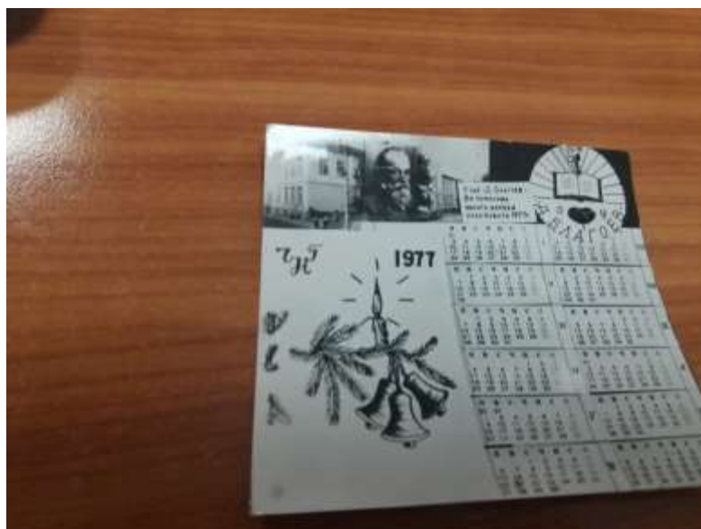
Фигура 4. Календарче за 1977 г., издадено от училище „Димитър Благоев“