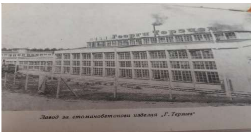
Фигура 2. Завод за стоманобетонени изделия „Георги Терзиев“ (Ivanov et al.,1966)

За леката промишленост значение имат ТПК „Милан Василев“ за производство на дрехи и папурени изделия и ТПК „Обединение“ за шивашки и обушарски изделия. Градският промишлен комбинат произвеждал ламаринени изделия, част от които се изработвали единствено тук за разпространение в цялата страна.